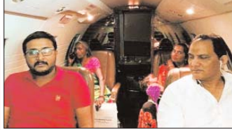
प्रयागराज, मारुति एक्सप्रेस | (LUNI छात्रोंसे)

कांग्रेस की महासचिव और पूर्वी उत्तर प्रदेश की प्रगती प्रियंका गांधी ने इलाहाबाद की मिनाल पेश की है। एक ट्यूमर पीड़ित बच्ची के लिए उन्होंने जो किया है उसे शायद ही इसका प्रयाग कभी भूल पाएगा। उन्होंने बच्ची को खास प्लेन से ना केवल एक्स मिनालवा बल्कि टाइले के वक्त सुदू गैरुट रखने की भी बात कही। दरअसल इलाहाबाद के कलाहा नेहरू अस्पताल में ट्यूमर से गुजर रही एक बच्ची पढ़ती।