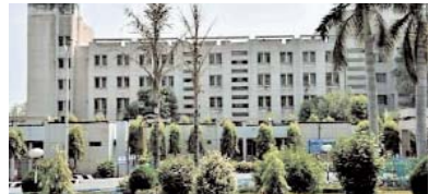
सिंगरौली (मारुति एक्सप्रेस)।

मामला नेहरू शताब्दी चिकित्सालय सिंगरौली का, अस्पताल प्रबंधन लापरवाह