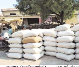
अजयगढ़, (मारुति एक्सप्रेस)। अजयगढ़ कृषि अउन मण्डी में टैन शेड में अन्नधान्य का कक्का होना से भगवत योजना के तहत अन्नान बचने आने वाला किसान धूर में अपना अन्नान राख कर 45 डिग्री तापमान में झुलसने को मजबूर है। वर्तमान में यहां प्रतिदिन