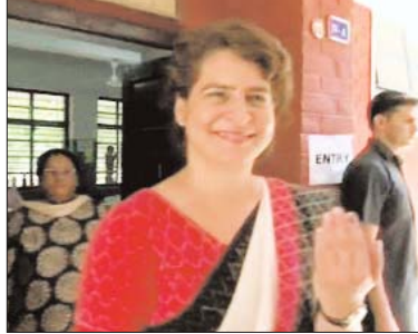
नई दिल्ली, मारुति एक्सप्रेस

कांग्रेस महासचिव प्रियंका गांधी ने अपने पति राहुल वोट के साथ वोट डाला है। प्रियंका और राहुल वाइस प्रेसिडेंट के विद्या भवन महाविद्यालय सीनियर सेकेंडरी स्टेज में मतदान करने पहुंचे थे। वोट डालने के बाद मीडिया से बातचीत में प्रियंका गांधी ने कहा कि इस बार स्पष्ट है कि बीजेपी जा रही है। उन्होंने यह भी कहा कि वर्तमान सरकार से जनता त्रस्त है और परेला है। प्रियंका गांधी अपने पति राहुल वोट के साथ पेंशन हो पॉलिंग वृत्त पहुंचीं। वोट डालने के बाद प्रियंका गांधी और राहुल वाइस प्रेसिडेंट लगी उल्लास मॉडिया के कैमरों के सामने दिखाए। वोट के बाद प्रियंका गांधी ने मीडिया से बातचीत में कहा कि हमने लोकतंत्र बचाने के लिए मतदान किया है। जनता में आक्रोश है, जनता त्रस्त और परेला है। स्पष्ट है कि बीजेपी को सरकार जा रही है, वह हार रही है।