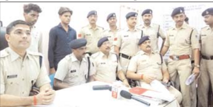
बद रही थी पुलिस कप्तान के दिशा निर्देशन में कोतवाली पुलिस द्वारा मोटर साइकिल चोर गिरोह के सदस्यों को बड़ी मेहनत के बाद गिरफ्त में लेने में सफलता प्राप्त की।