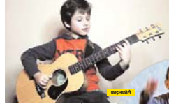
सतना (मारुति एक्सप्रेस)।

ध्वारी गली नं. 5 में प्राइमरी स्कूल के सामने संचालित माय प्लानेट किड्स एकेडमी द्वारा मीडिया पार्टनर मारुति एक्सप्रेस के संयोजन में 14 मई से समर क्लासेस का शुभारंभ किया जा रहा है। जिसमें गर्मियों की छुट्टियों में 3 वर्ष से 15 वर्ष तक के बच्चों को योग्य प्रशिक्षण दिया जायेगा।