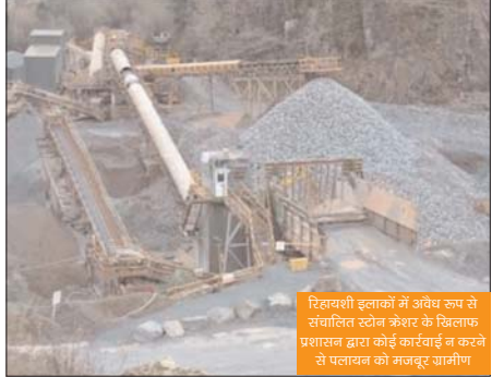
रिहासशी इलाकों में अवैध रूप से संचालित स्टोन क्रेशर के खिलफ प्रशासन द्वारा कोई कार्रवाई न करने से पलायन की मजबूर ग्रामीण

मऊगंज तहसील अंतर्गत चल रहे अवैध स्टोन क्रेशर द्वारा फैलाया जा रहा प्रदूषण जिस गजब से क्षेत्र के लोग पलायन के लिए मजबूर हो चुके हैं क्योंकि उनके द्वारा कई बार जांच के लिए आदेश दिए गए किंतु प्रशासन द्वारा कोई कार्रवाई नहीं की गई ऐसा लगता है कि भ्रष्टाचार की जड़े इतनी मजबूत हो चुकी है की अब उन जड़ों को खोदने से भी भ्रष्टाचार खत्म होना वाला नहीं है।