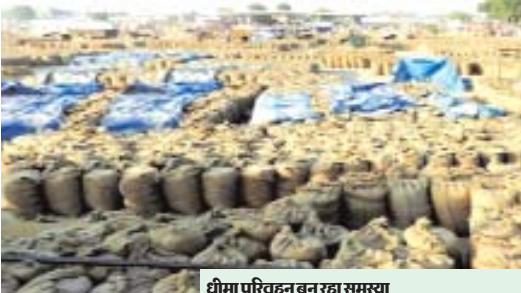
1 लाख 15 हजार मेट्रिक टन की खरीदी

जिले में अभी तक समर्थन मूल्य पर गेहूं की कुल खरीदी 1 लाख 15 हजार मेट्रिक टन हुई है। सूची से मिली जानकारी के मुताबिक जिले भर के खेती क्षेत्रों में चुनाव बाद किसान जनकपुर अपना अनाज लेकर पहुंच रहे हैं।