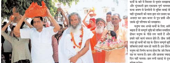
परिचित बना एवं शुक्लेश्वर आगमन की कथा सुनाई। महाराज ने कहा कि भावना को लीला अर्पण है। वे अपनी लीलाओं के माध्यम से मनुष्य व देवताओं के धर्मनुरसर अचरण करने के लिए प्रेरित करते हैं। भागवत कथा में जीवन का सार तत्व मौजूद है आश्चर्यकृत है निर्मल मन और स्थिर चित्त के साथ कथा श्रवण करने की शक्ति ही है। भागवत श्रवण से मनुष्य को परमानन्द की प्राप्ति होती है। भागवत श्रवण प्रेतयोनियों से मुक्ति मिलती है। भागवत कथा में जीवन का सार तत्व मौजूद है आश्चर्यकृत है निर्मल मन और स्थिर चित्त के साथ कथा श्रवण करने की शक्ति ही है। भागवत श्रवण से मनुष्य को परमानन्द की प्राप्ति होती है। भागवत श्रवण प्रेतयोनियों से मुक्ति मिलती है। भागवत कथा में जीवन का सार तत्व मौजूद है आश्चर्यकृत है निर्मल मन और स्थिर चित्त के साथ कथा श्रवण करने की शक्ति ही है।