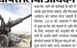
काश कि आगे की कार्रवाई के बारे में निर्णय उसके द्वारा लिया जाएगा और फिलहाल वह आवेदन को वापस लेना चाहती है। चार दिव्डी, 2018 को अरुवल ने सीबीआई से पूछा था कि उसे मामले में आगे की जांच के लिए अरुवल को अनुमति की जरूरत क्या है। इससे पहले उरुवतम न्यायालय ने बोफोर्स मामले में हिंदुजा बंधुओं को आरोप मुक्त करने वाले उरुव न्यायालय के फैसले को चुनौती देने वाली सीबीआई की याचिका खारिज कर दी थी। न्यायालय ने कहा था कि बोफोर्स मामले में उरुव न्यायालय द्वारा हिंदुजा बंधुओं को आरोप मुक्त किए जाने के खिलाफ अपील दायर करने में हुई देरी के संबंध में सीबीआई ने जो दलील दी है उससे बस संतुष्ट नहीं है।