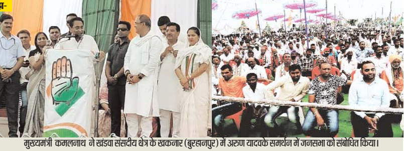
मुख्यमंत्री कमलनाथ ने खंडवा संसदीय क्षेत्र के खकनार (बुरहानपुर) में अरुण यादवक समर्थन में जनसभा को संबोधित किया।

अमाल और महाअमाल सपी तरह की जाकवारियों जुटा चुके हैं और उनके प्रुननुामन पार्टी सगुनौं के सामने पेश भी किए जा चुके हैं। काग्रेस सूरजों का दावा है कि उनके पास गुननुजुन है। वो अक्षरत हैं और परिस्थितियों को अपने पक्ष में समझ रहे हैं। काग्रेस सूरजों ने बताया कि यूपीए चेतारनम होने के नते सोनिया गांधी ने मधुप्रदेश के मुख्यमंत्री को काग्रेस नेता कमलनाथ को रौर-भाजपाई दलौं से गुननुवन के लिए बात करने की जिम्मेदारी सौंपी है। कहा जा रहा है कि कमलनाथ एनएच में शामिल कुलु लौं के नेता सौं से भी बात कर सकते हैं। बता दें कि एनएच में गठबन्धन की इतनी कला के कारण कमलनाथ करिव 4.5 वर्षों ने गांधी परिवार के नजदीकी बने हुए हैं।