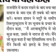
राजनीति में कदम रखने के बाद बना वह समाज के बस एक ही तबके की बात करे। कमल हासन ने मद्र के समीप तिरुचिरापल्ली में जा चुनाव के प्रचार के दौरान कहा, 'मैं अरुवाकुटिच में जो कुछ कहा, उससे मे नाराज हो पारे। मैंने जो कुछ कहा है वह ऐतिहासिक सच है। मैंने किसी को धमके के लिए नहीं उरनुवाया।