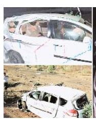
सागर, मारुति एक्सप्रेस | (UNI एजेंसी) मध्य प्रदेश के सागर जिले के देवरी में एक सड़क हादसे में चार युवकों की मौत हो गई। यह सप्ती एक शादी समारोह से रौर लौट रहे थे। तभी उनकी कार तेर रफतार में अनियंत्रित होकर खाई में जा गरी। हादसे में मौक पर ही तीन लोगों की मौत हो गई,