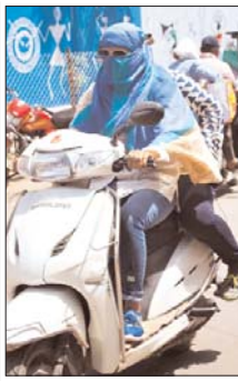
सतना (मारुति एक्सप्रेस)।