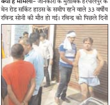
बुजुर्ग ने खाना खाकर अपने कमरे में लगा ली फांसी