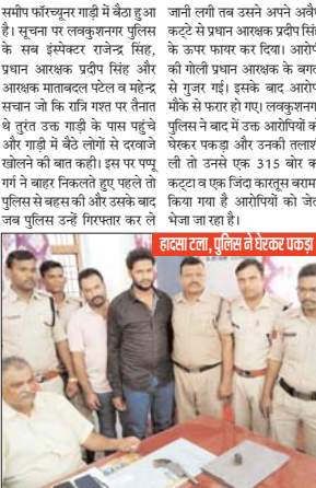
हालत दाला, पुलिस ने थैकर पकड़ा