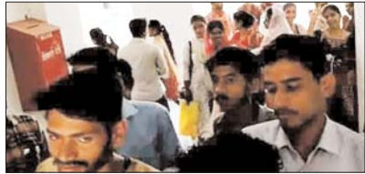
छात्रों का एक समूह जो गेट पर ताला लगाकर अंदर प्रवेश करने से रोका गया है।