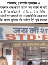
रामनगर (मारुति एक्सप्रेस)। हासिल जानकारी के मुताबिक चोरों द्वारा सांई मॉडर से बाल से स्थित मिट्टियां मोबाइल शॉप के पीछे से टीन एवं प्लां काटकर एक छेद बनाया गया। बताया जाता है कि इसकें जरिये किसी 10-12 साल के बच्चे को अंदर भेजकर दुकान से कैश