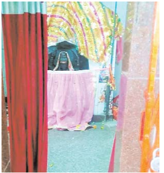
सतना (मारुति एक्सप्रेस)।

रामगढ़ के राम मंदिर से चोरी गई अष्टधातु की सीता- लक्ष्मण की मूर्तियां